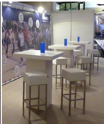
Hoge tafels en krukken