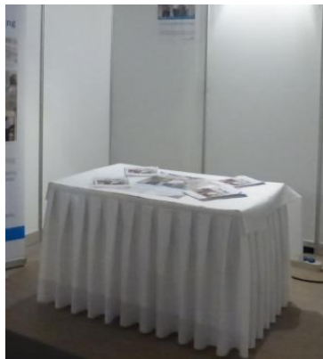
Afgerokte lage tafel

Het plasmascherm is 42" en wordt geleverd met een standaard.