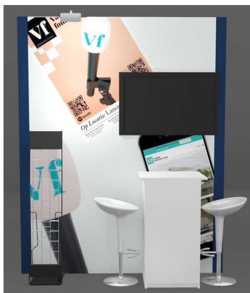
Stand met witte advantafel

Het plasmascherm is 42" en wordt geleverd met een standaard.